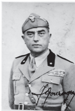
Generale Vincenzo Ferrante Gonzaga (Torino, 6 marzo 1889 – Eboli, 8 settembre 1943)