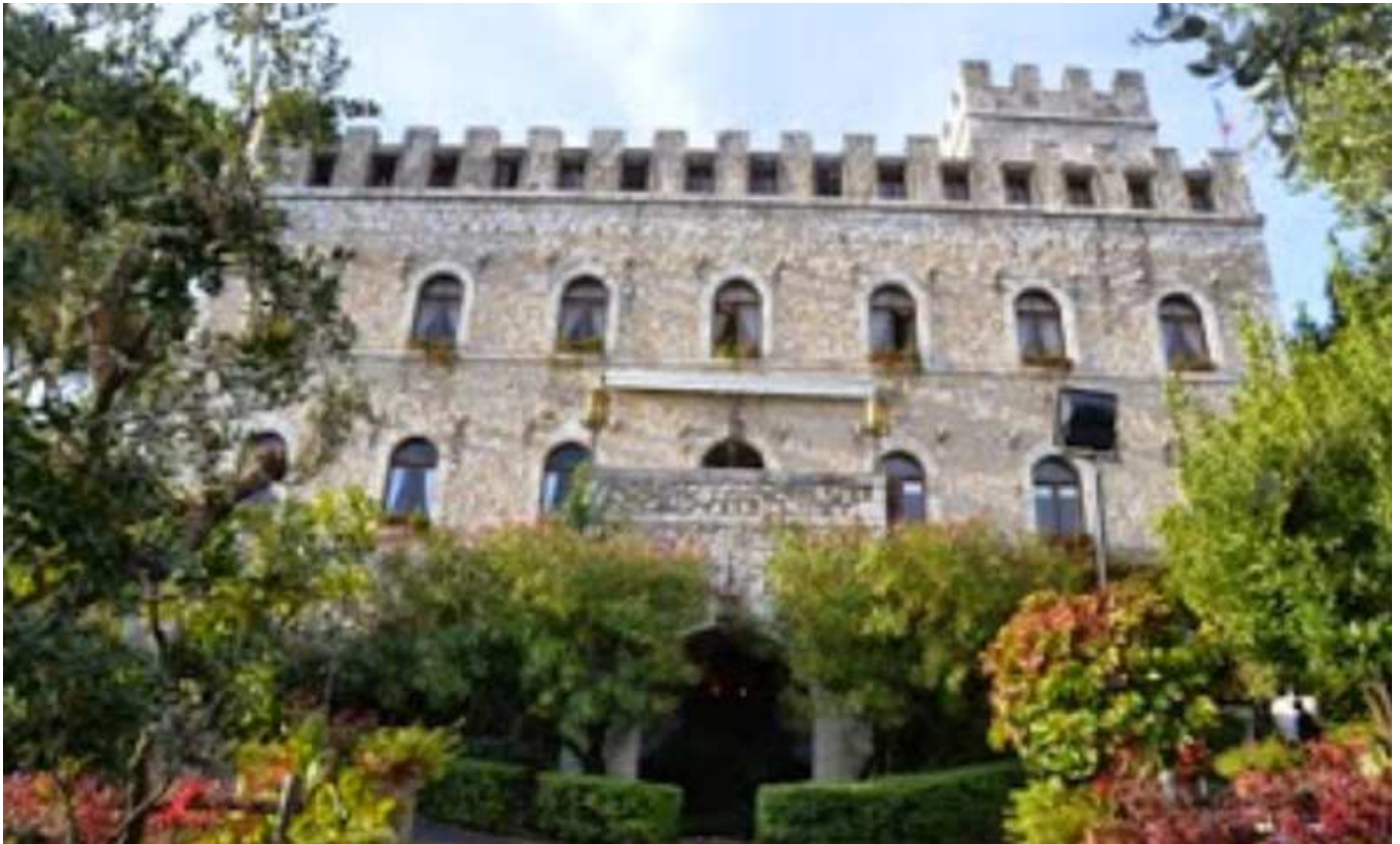
Il castello Miramare, sede della Cerimonia di premiazione del premio internazionale Tulliola Filippelli