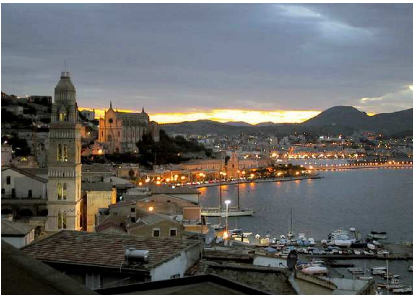
La città di Formia, sede del Premio letterario internazionale Tulliola - Renato Filippelli.

Preziose opere dell'artista Gerardo De Meo.